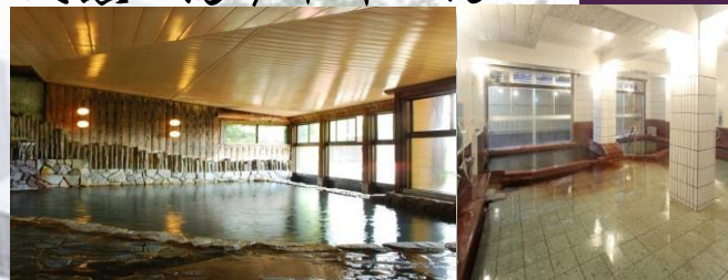
貸切露天風呂月待の湯